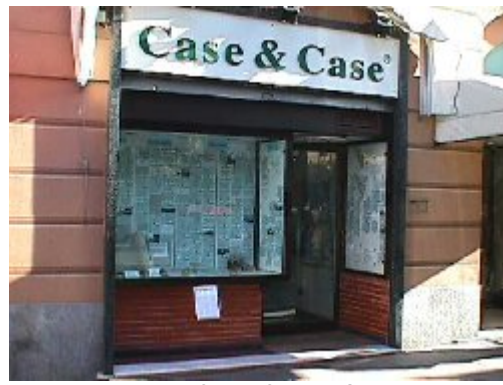
Modulo specifiche immobile scaricato dal sito dello studio Immobiliare Case&Case di Savona